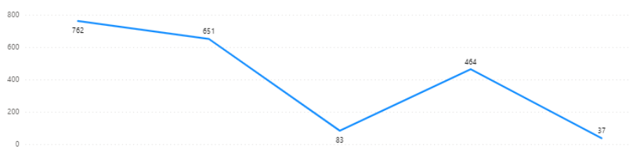
Número de respondentes nos meses de abril a agosto - 2021