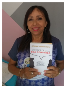
Auriam - Presidente Prudente (Maranhão)