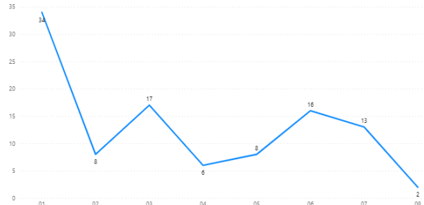
Registros finalizados no mês de setembro - 2021